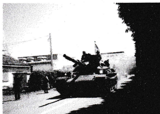
むかし特需、いま戦車 練馬区内を進軍(?)